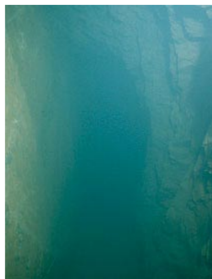
Høyre: På 18 meters dyp går det inn en ort.

Sikten er null og jeg famler meg frem i blinde. Får litt negative tanker om at dette kan gå galt og må ta meg sammen. Kan en planke ha forskjøvet seg?